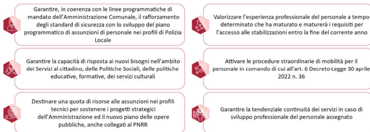
Figura III.1: Le direttrici della manovra occupazionale 2022-2024

La programmazione del fabbisogno 2022-2024, determinata in seguito alle verifiche presso le direzioni del contingente di personale necessario allo svolgimento dei compiti istituzionali e dell'assenza di eccedenze e situazioni di sovrannumerarietà, è orientata alle direttrici di seguito indicate: