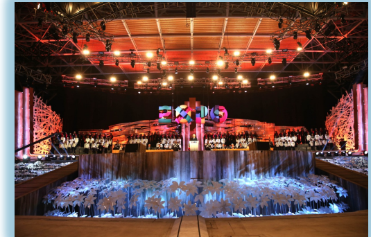
I Piccoli Cantori a Expo 2015

in ospedali, istituti geriatrici, enti per ciechi, per la lotta contro i tumori., ecc.