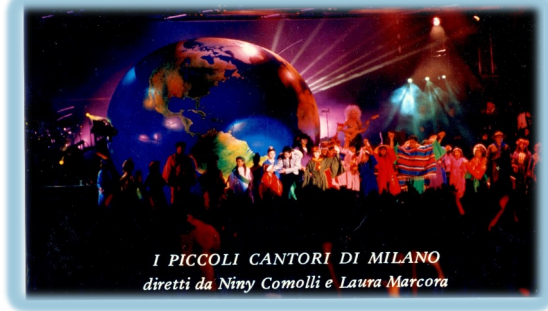
I Piccoli Cantori con Michael Jackson